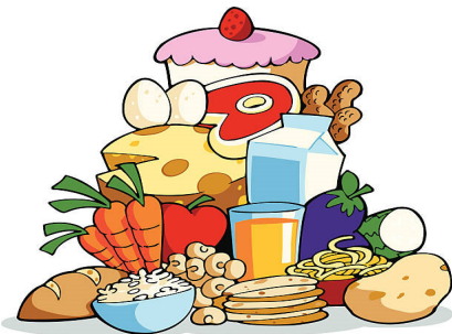
Mittagessen in Kitas, Schulen und Kindertagespflege