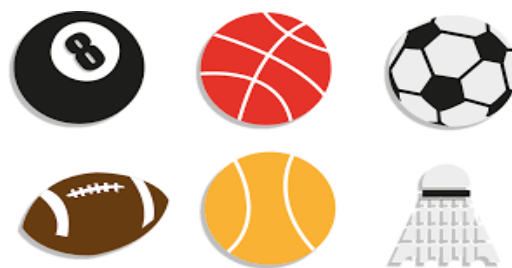
Kultur, Sport und Freizeit